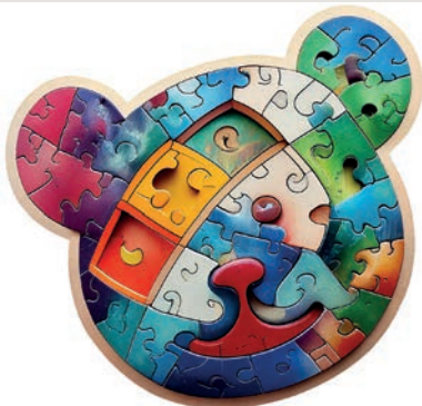
Ein Team – gemeinsam stark