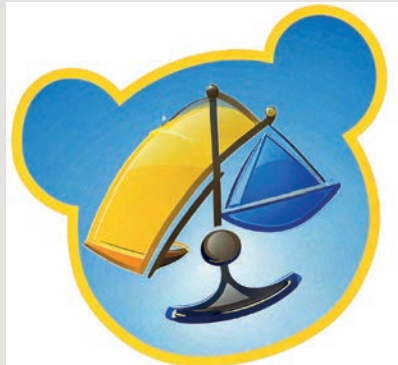
Inklusion ab Wickeltisch