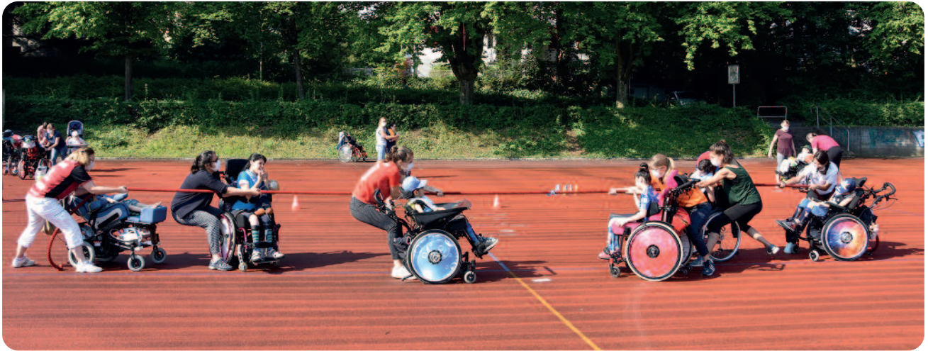
Der Sporttag brachte Abwechslung in den Schulalltag.

zu den oberen Schulzimmern für die Schüler nicht zu meistern sind. Bis auf wenige Details ist das Bauprojekt nun abgeschlossen, und der Kanton Zürich prüft die von uns eingereichten Unterlagen. Wir sind dankbar, dass der Kanton bereits zugesagt hat, auch die nicht budgetierten Mehrkosten gemäss Verteilschlüssel mitzutragen.