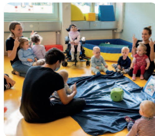
Das Kinderhaus Imago – eine Kita für alle Kinder.

Ohne die enorme finanzielle und personelle Unterstützung wäre das Angebot der Stiftung visoparents nicht möglich. Wir bedanken uns herzlich für die zahlreichen Zuwendungen und Sachspenden von Stiftungen, Privatpersonen, Vereinen und Firmen, für die zahllosen Einsatzstunden der freiwilligen Helferinnen und Helfer mit ihrer Arbeit bei sozialen Einsätzen, im Haushalt, bei Veranstaltungen, Auf- und Umräumarbeiten und mit Dienstleistungen in der Kommunikation.