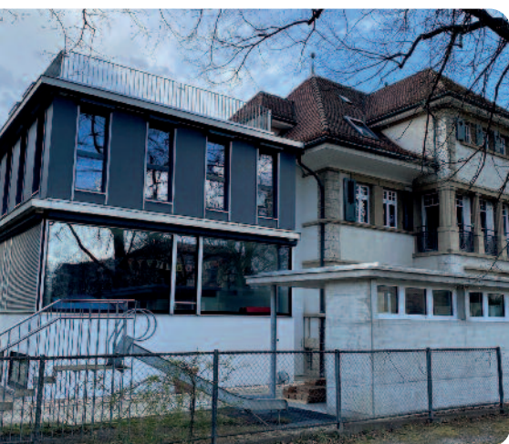
Der An- und Umbau der Tagesschule visoparents wurde 2020 abgeschlossen.

In der Tagesschule betreuen wir mehrfach behinderte Kinder im Alter von 4 bis 18 Jahren, die im Kanton Zürich wohnen. Mit dem An- und Umbau konnte dringend benötigter zusätzlicher Raum geschaffen werden. Die Inbetriebnahme eines zweiten Lifts Anfang Jahr brachte grosse Erleichterung, da die Treppenstufen